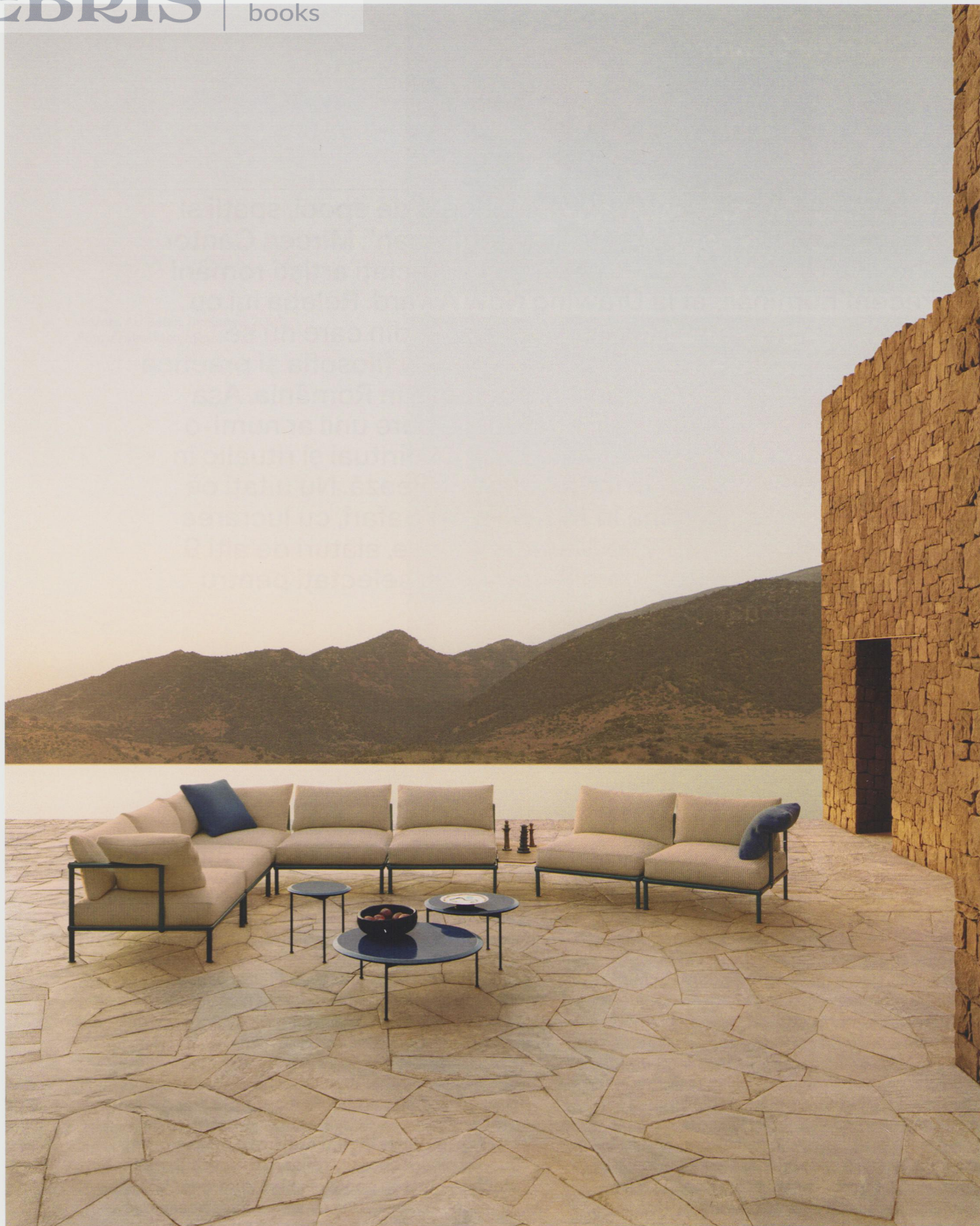
Nooch sofa system, design Piero Lissoni. bebitalia.com