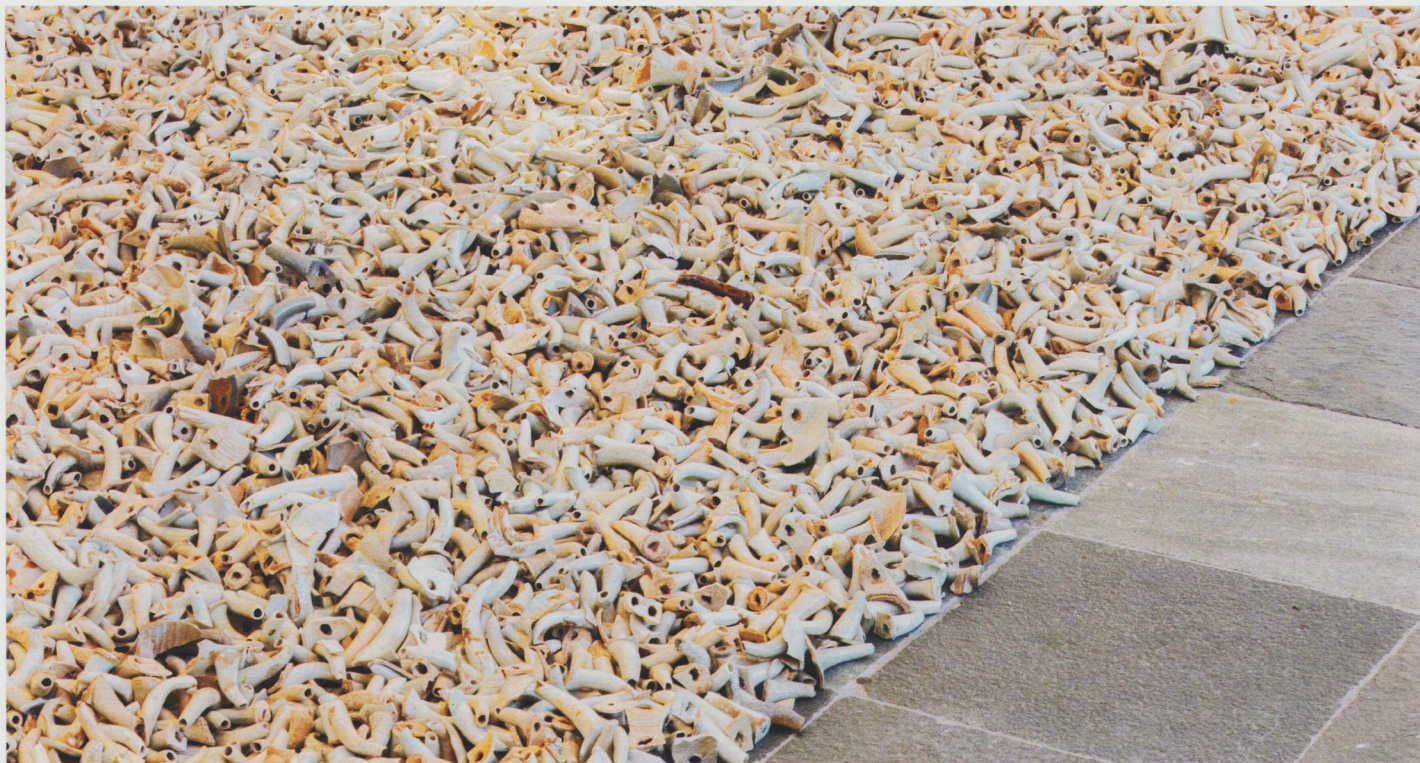
Ai Weiwei, Spouts , 2015.

Recent a avut loc deschiderea expoziției Ai Weiwei: Making Sense la Design Museum din Londra, care poate fi vizitată până în 30 iulie 2023. O expoziție ce glisează între autoreferențialitate, design, arhitectură, arheologie și colecționism, trasând 8 milenii din istoria designului.