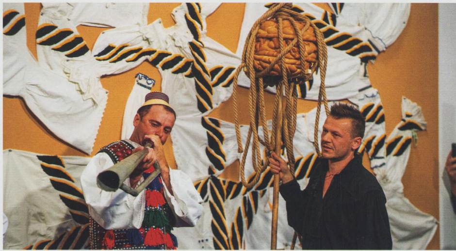
Rozeta, Art Safari, București, 2023.